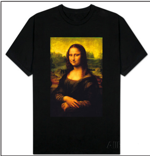
تصویر ۱. استفاده از تصویر هنری (مونالیزا) جهت فروش کالا.